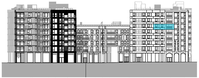
Fasade mot vest