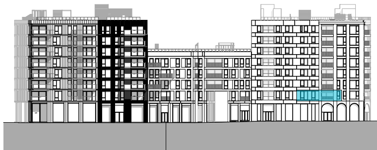
Fasade mot vest