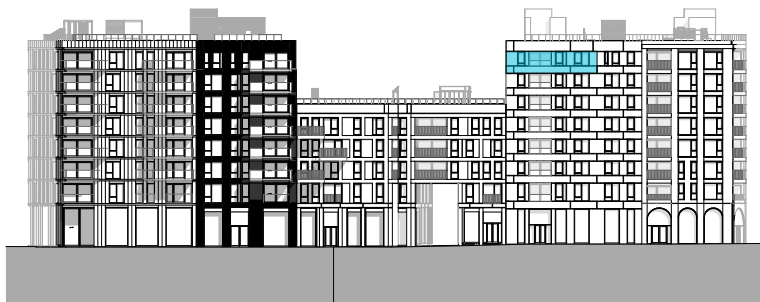
Fasade mot vest