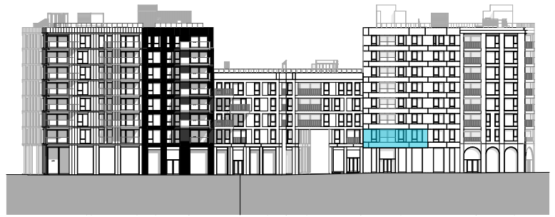
Fasade mot vest