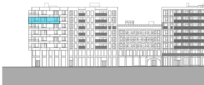
Fasade mot øst