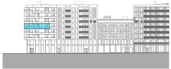
Fasade mot øst