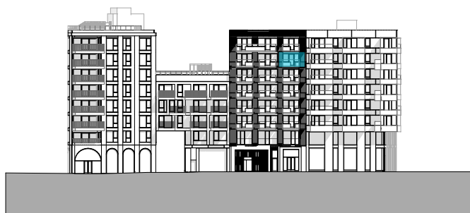
Fasade mot sør