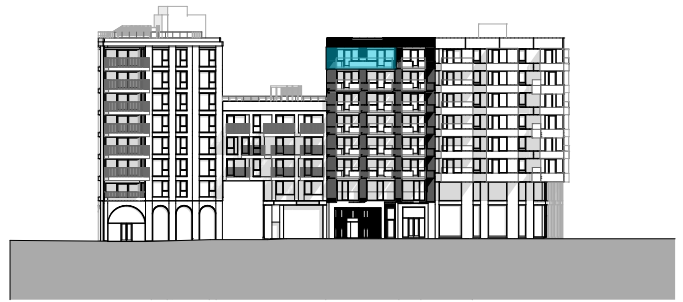
Fasade mot sør