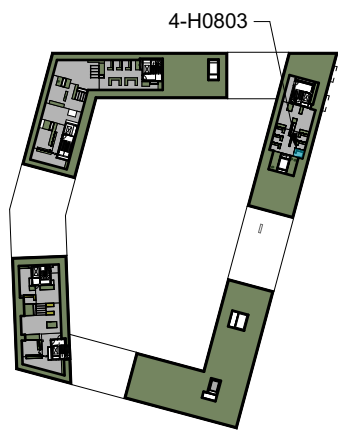
Takterrasse plan 9