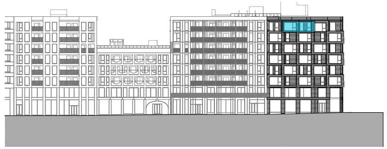
Fasade mot øst