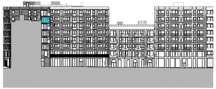
Fasade mot vest i gården