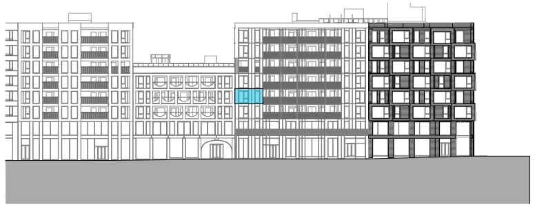
Fasade mot øst