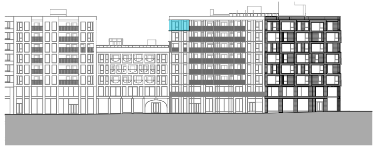
Fasade mot øst