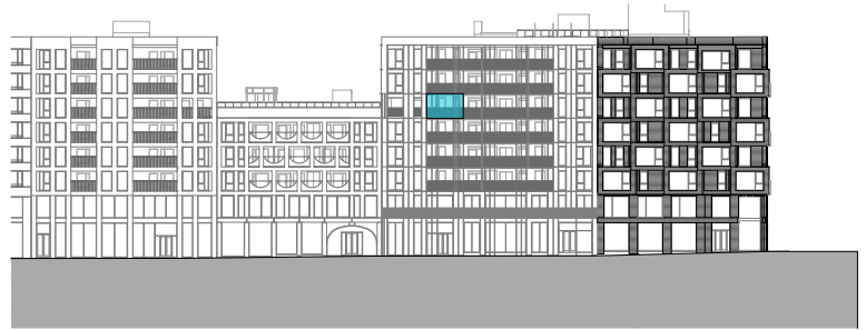
Fasade mot øst

Bygget er ikke ferdig detaljert og endringer i forbindelse med prosjektering og bygging må kunne påregnes, blant annet for areal, størrelse og plassering av tekniske installasjoner, sjakter og nedføringer. Hele eller deler av området markert som nedsenket himling kan bli nedført som følge av tekniske føringer.