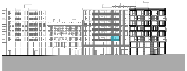
Fasade mot øst